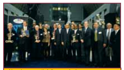
Alcuni momenti della premiazione / The award ceremony