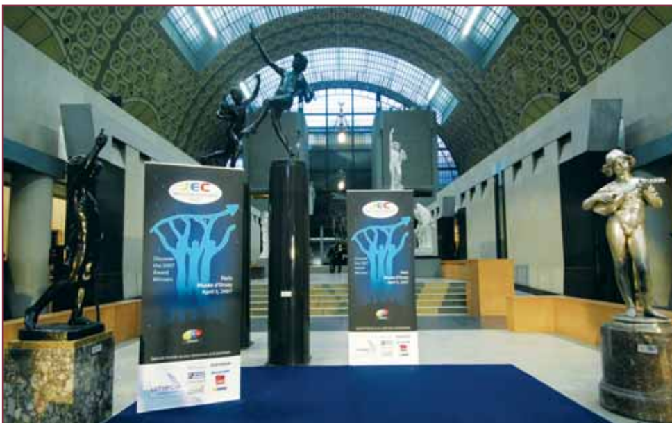
Il Jec Innovation Award al Museo d'Orsay / The Jec Innovation Award at the d'Orsay Museum