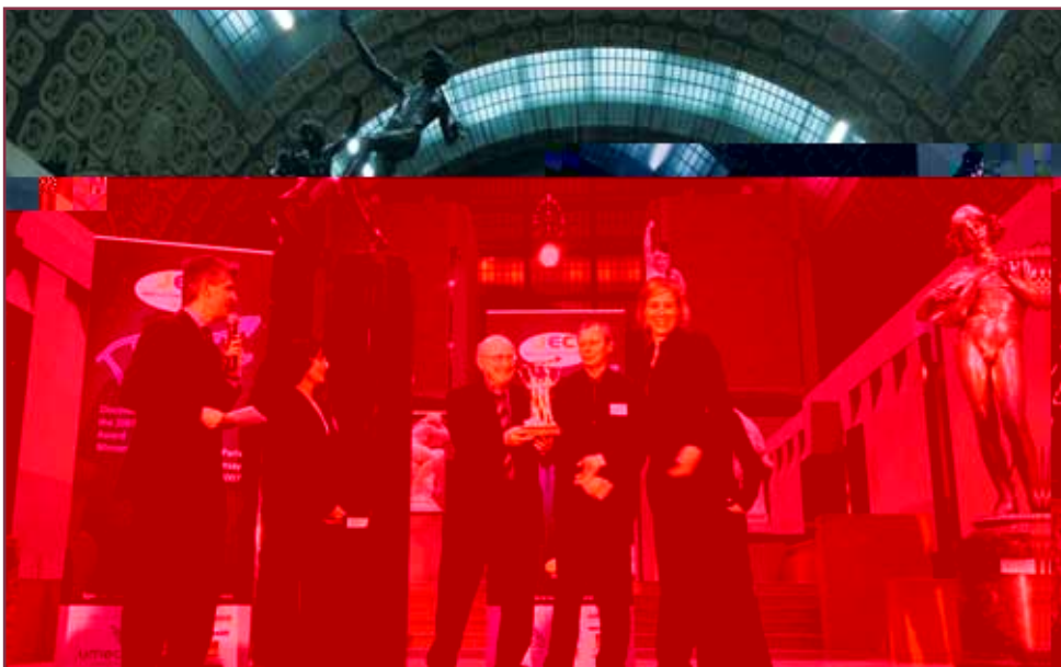
Via Mare ha premiato i vincitori per il settore nautico / Via Mare presented the Award for the Marine category